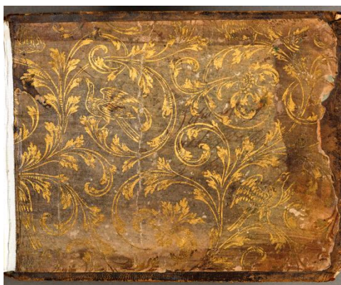
Bakre pärmens insida