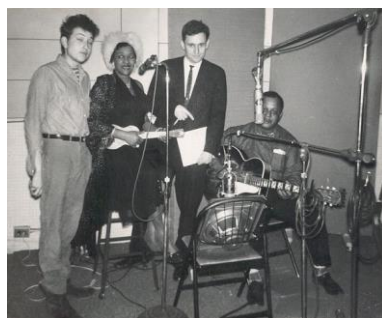
Bob Dylan, Victoria Spivey, okänd, Big Joe Williams, mars 1962

Well, I got a harmonica job, begun to play Blowin' my lungs out for a dollar a day 92