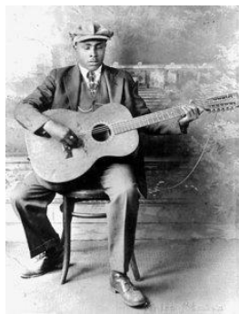
Blind Willie McTell, 1898–1959

I traveled through East Texas Where many martyrs fell And I know no one can sing the blues Like Blind Willie McTell Bob Dylan 43