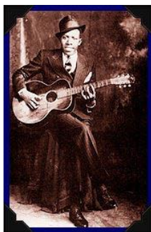
Robert Johnson, 1911–1938