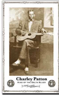
Charley Patton, 1891–1934

Inget är så praktiskt som en god teori 12