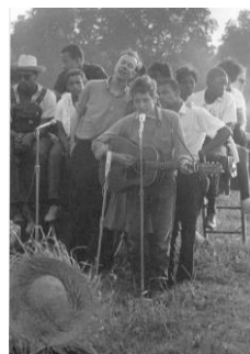
Greenwood juli 1963